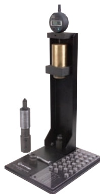
Figure 4 Gabarit Delphi AO HK883