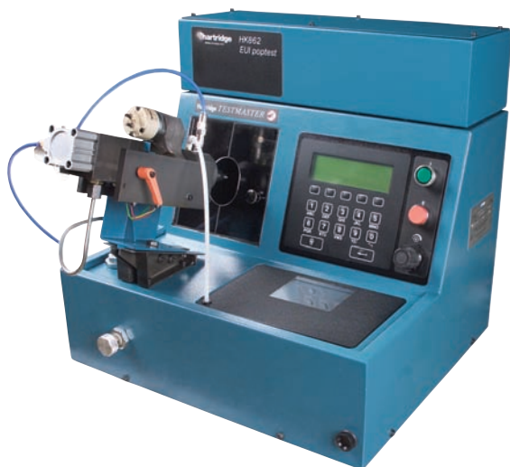
Figure 2 HH701 Testmaster 3 avec HK862 EUI Poptest