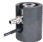
Figure 5 Kit applicatif dynamométrique Delphi HB388