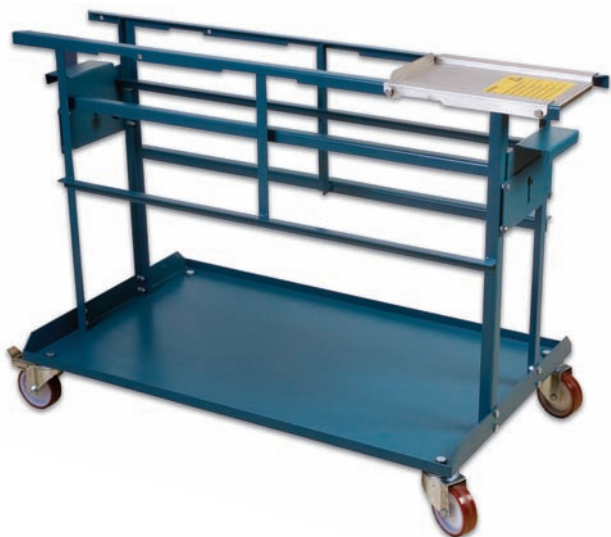
Figure 3 Chariot HM1050